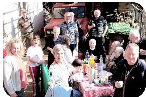
Besøg ved privat familier

Ring efter brochure for mere information !