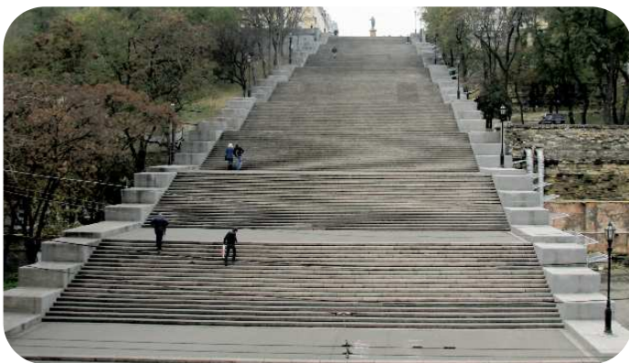
Den mystiske potemkin trappe i Odessa

Rumænien, Moldova og Ukraine er stadig uspolerede lande!