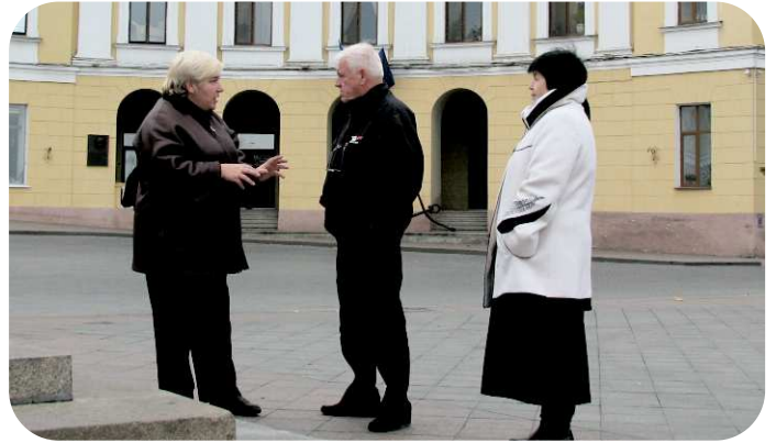
J.S.sammen med vores lokale hjælpere i Odessa

Vi tillader os naturligvis sædvanlig forbehold for Force Majeure - krig, strejker, blokader, naturkatastrofer m.m. Ting vi ikke har indflydelse på.