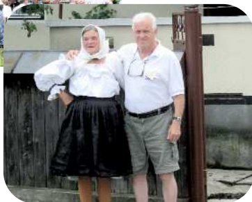
et kønt par