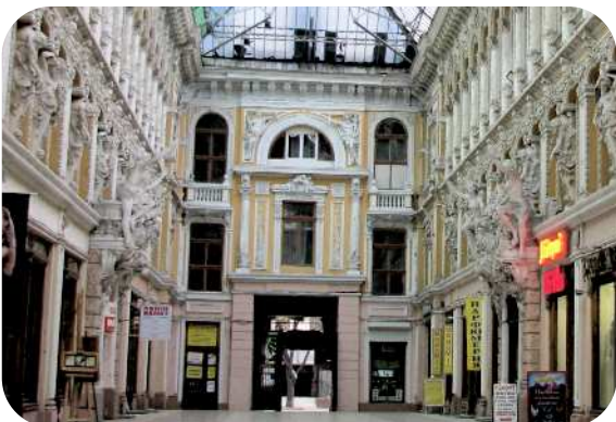
Fra en Arcade i Odessa