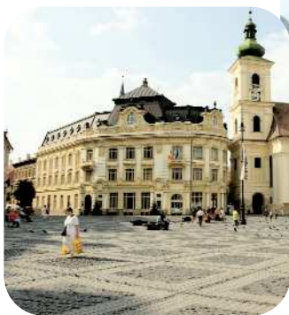
Store plads i Sibiu