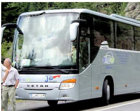
Her har vi vores 4**** luksus bus

email: js@jsrejser.dk - Åbningstid: Hverdage kl. 09:00 til 17:00 - weekend & helligdage kl. 10:00 til 14:00