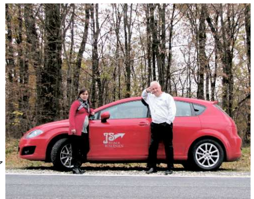
Team J.S. Rejser