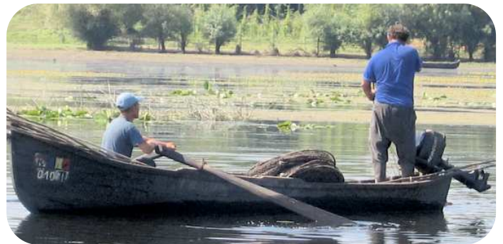
Fiskere på Donau Deltaet