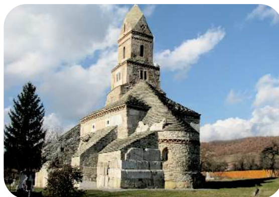
Den ældste stenkirke i Rumænien der er i brug endnu

Såvel vores kunder, som vi selv, mener at vi har en lav pris, hvor man får meget for pengene. Prisen, kan holdes nede, da vi har et minimum af omkostninger, fordi vi laver næsten alting selv. Desuden tilstræber vi en service, man ikke får ret mange andre steder. Men man kan ikke gøre alle tilfredse. Vi har registreret meget få reklamationer igennem årene, alt sammen ting vi ikke havde indflydelse på.