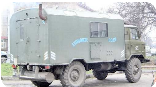
En ukrainsk mandskabsvogn for landarbejder

J.S. Rejser prøver igennem vores ture at hjælpe de mennesker, vi har med at gøre.