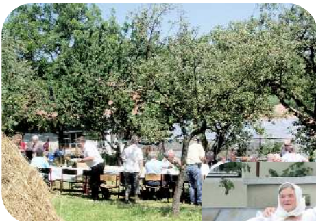
Forkost ved privat familie

En af de bedste måder at rejse i Rumænien på. Man kommer tættere på befolkningen. Selvom man er betalende gæst kan man ikke føle sig som andet end som ven af familien. Der bliver man budt velkommen, snakker (hvis man ellers finder et fælles sprog), smager på den lokale brændevin (Tuica) og nyder det vældige rumænske landkøkken. Alle pensionerne er godkendt af myndighederne. På vores ture spiser vi morgenmad ved de familier vi bor ved. Aftensmaden indtager vi sammen, netop på grund af sprogbarrieren.