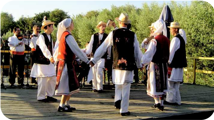
Folkedanser ved Donau Deltaet