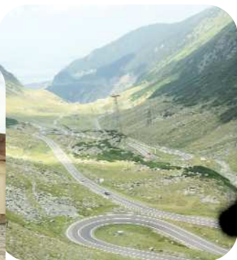
Oppe i 2000 m i Sydcarpaterne