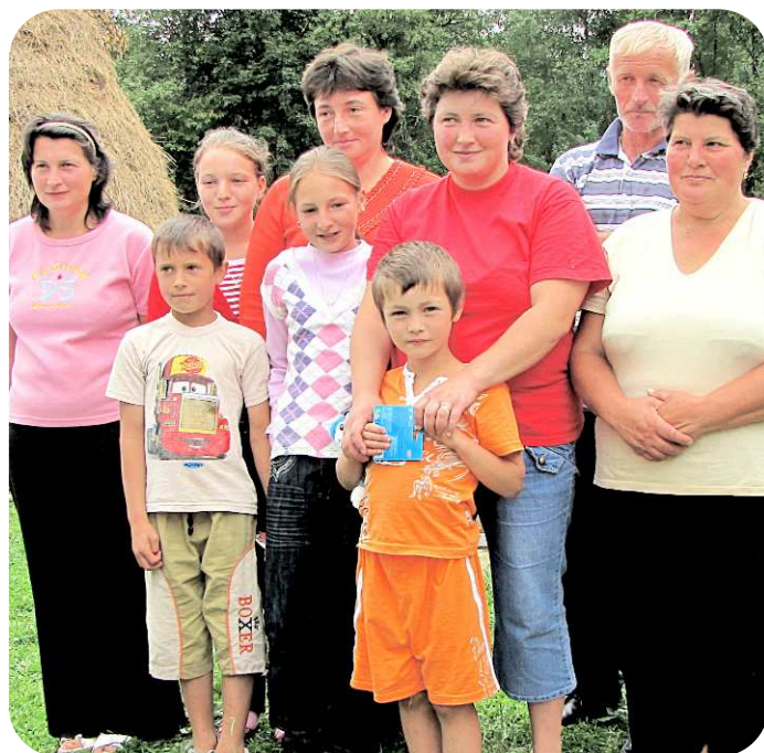
Her er en familie der åbnede deres døre hvor vi havde picnic