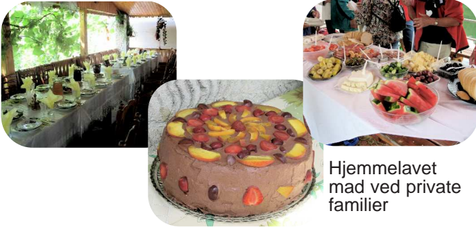
Hjemmelavet mad ved private familier

Mineralvand i flaske er udmærket og hedder „ Apa Minerala “. Som aperitif får man sædvanligvis „ Tuica “ (blomme-, æble- eller pæresnaps). Særlig gode hvidvine i mange udgaver. Rødvine er nu af bedre kvalitet end før, mest kendt er „ Murfatlar “. Lokal øl er udmærket både i Rumænien, men også i Republik Moldova, Serbien og Ukraine.